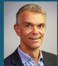
Pr Luigi NIBALI, Londres

Cette conférence se concentre sur les protocoles MINST pour les défauts intra-osseux et plus particulièrement sur les défauts qui pourraient cicatriser sans avoir recours à une approche chirurgicale. Des exemples de cas seront présentés, ainsi qu'une revue complète de la littérature sur ce sujet. Des résultats cliniques et radiographiques à long terme de défauts intra-osseux traités par MINST seront présentés, montrant une stabilité sur une période de 5 ans. Des éléments de preuve et des hypothèses récentes sur les modèles de cicatrisation après MINST seront discutés.